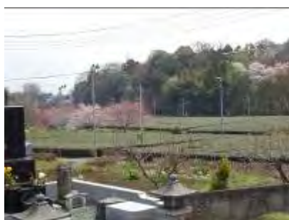
慈眼庵からクロスケの家の 方面を臨む