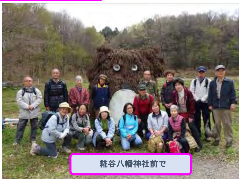
糞谷八幡神社前で