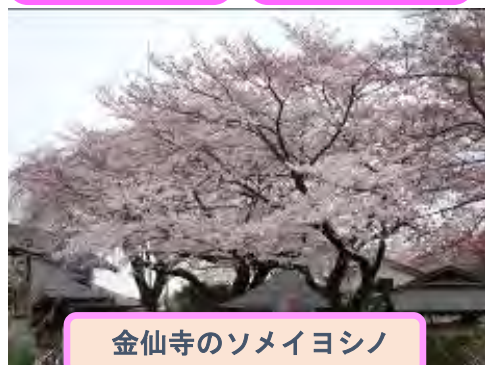
金仙寺のソメイヨシノ

今月の行事は 19 期の市民大学の歴史グループで一度歩いたコースをまた辿ってみました。天気にもまれて、皆で楽しい一日を過ごしました。