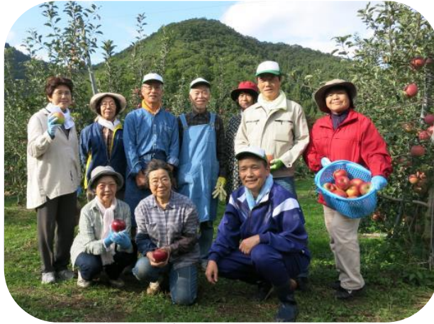
今回は9名(初参加1名)の参加でした。