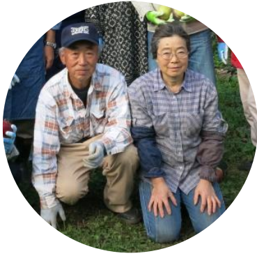
本当に忙しいお二人です。 ありがとうございました。

宿泊、食事のお世話から、温泉や夕食にもご夫婦でお付き合いいただき、ありがとうございました。