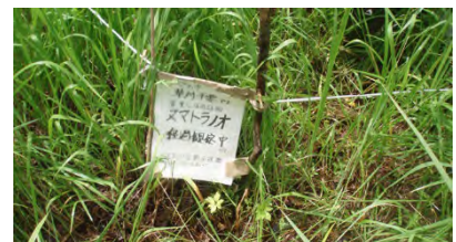
[07/15 ヌマトラノオ保護張り紙]