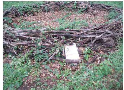
[07/15 バイオネスト点検]