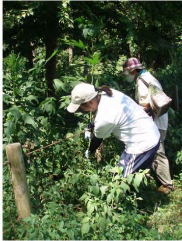
[07/29 オオブタクサに挑戦]