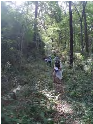
[10/31 なんとか通れるように]