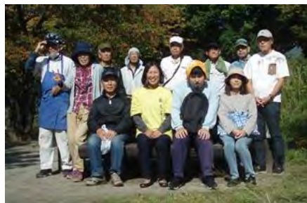
[10/12 作業開始前集合写真]

特記事項は、①湿地はやや湿り気がある感じでした。湿地周辺は彼岸花が咲いていました。②新園路、東西通りの東側、湿地などの刈り込みがされていました。なおこの日は晴天にも恵まれて、多数の園児たちが遊具施設で楽しんでいました。