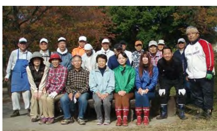
[10/31 作業参加者集合写真]

管理棟です。コース記号は、イ-K-L-I-F-G-0-a-a' -k-i-ロ-C-B-W-b' -b-g-g' -A-d-N-K となります。